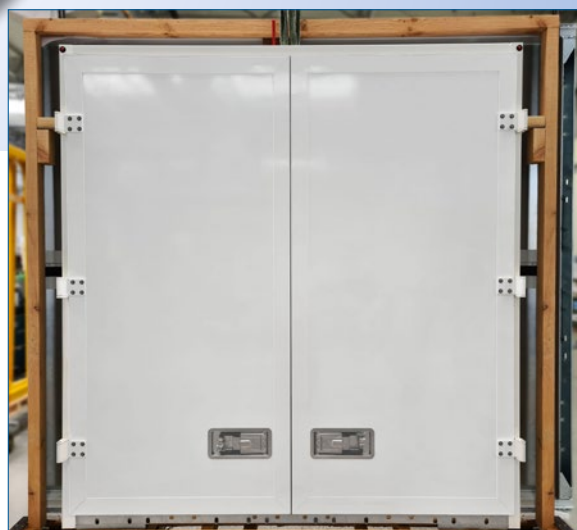
Jetzt mit einstellbaren Türenscharnieren

Die Hecktüren mit außenliegenden Drehstangen oder eingelassenen Verschlussmulden stellen Sie , falls erforderlich, über die Scharniere ein . Die neue Integraltür ersetzt vollständig die beiden bisherigen Varianten .