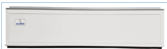
Optimierte Türen und Klappen ab Oktober 2021

Sie sind bzgl. der Ladungssicherung zertifiziert . Das gleichmäßige Spaltmaß bewirkt eine ruhige Optik. Verwendungen an den Gehrungsecken sind ausgeschlossen.