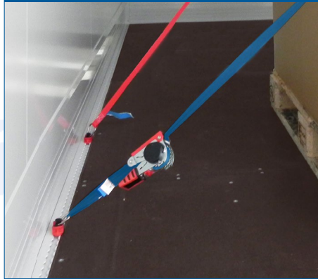
im Boden umlaufend ( immer! )